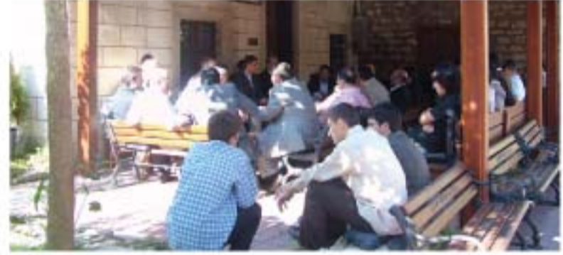
Vakıf bahçesinde çay eşliğinde yapılan sıcak ve samimi sohbetlerle devam etti.

Program sonrasında ilk dönem mezunlarımız vakfımıza geçerek sohbet ve eski günleri yâd etmeye devam etmişlerdir.