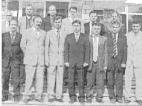
İstanbul Siyasal Mezunları Kocaeli Grubu, Kandıra Kaymakamı Hamza Erkal'ı ziyaret için bir grupta toplandı.

İstanbul Siyasal Mezunları Kocaeli Grubu, bir süre önce göreve başlayan Kandıra Kaymakamı Hamza Erkal'a hayırlı olsun ziyaretinde bulundu