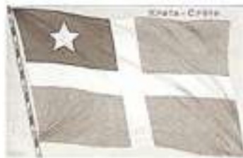
Girit Osmanlı devletinden koparılıp önce bağımsız ardından ise Avrupa'nın ayak oyunları ile Yunanistan'a bağlanmıştır. Yukarıdaki bayrak ise bu geçici bağımsızlık döneminde kullanılmıştır.

Etnik-i Eteryay (Yunanca "Ulusal Dernek")'nın 1894 yılında Osmanlı Türk egemenliği altındaki bölgelerde Yunan subay, papaz ve tüccarları ile kurulması ardından bu dernek Girit'in Türk idaresinden çıkmasını sağlamış, adadaki Rum azınlığı teşkilatlandırarak silahlandırmış ve Müslüman Türk çoğunluğa karşı kıskırtarak katliamların başlamasında önderlik etmişti.