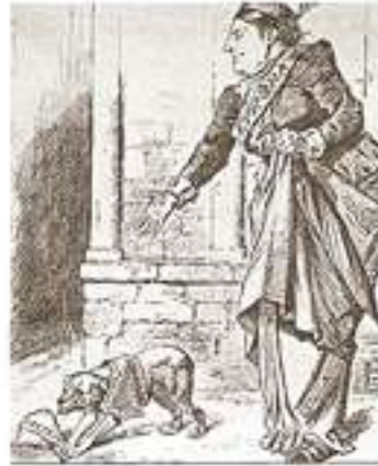
6 Mart 1897 tarihli bir İngiliz gazetesinde karikatürde Girit, Yunanistan'ın önüne atılan bir kemik olarak tasvir edilmektedir.

II. Dünya savaşı yıllarında 12-14 Kasım 1944'de Almanya'nın savaşı artık kaybettiği günlerde, Girit'te Almanlara karşı savaş veren çeteler bağımsızlık ilan etmeye hazırlanırken, İngiltere'nin askeri müdahalesi ile bağımsızlık hareketi bastırılmış, ada gene Yunanistan'a teslim edilmişti. Daha sonra 1970, 1973, 1974, 1976 ve 1980'de olmak üzere bir çok kez bağımsızlık girişimi olmuş ancak her ayaklanma çok sert bir şekilde bastırılmıştı. En büyük ayaklanma ise 1989 yılında gerçekleşti. ABD'nin Girit'te askeri üs kurmasını protesto eden binlerce kişi sokaklara dökülmüş, Ancak Yunan polislerinin sert müdahalesi üzerine halkın öfkesi artmış ve 30 bini kişiyi aşan bir Girit'in Yunanistan'a sus payı olarak verilmesini temsil eden kalabalık ellerinde çeşitli silahlarla kamu dairelerine saldırmışlardı. Ada tam bir savaş alanına dönmüştü. Silahlar patlamış yüzlerce kişi yaralanmıştı. Durum polisin kontrolünden çıkınca