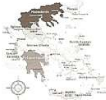
Girit adası Akdeniz'deki en büyük ikinci ada olması ve Orta Akdeniz'e hakim bir konumda olması nedeniyle önem taşıyor. Ayrıca Yunanistan'ın da güneyindeki en büyük yerleşim birimini oluşturuyor.

Türkler, Girit'e ilk kez 1341 yılında ayak bastı. 1427'de Girit'e gelen Osmanlı Donanması, bu seferlerini 1538'de Barbaros Hayrettin Paşa komutasında da sürdürdü. 1567'de Türk akınları tekrarlandı. 1645'de Girit'i tümü ile fethetme hareketi başladı. Önceleri sadece Hanya ve Retimno gibi şehirlerde kurulan Türk hakimiyeti, zaman içinde Kandiyeye dışında tüm adaya yayıldı.