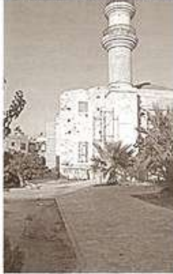
Girit Ulu Camii bugünlerde kubbesi çökmüş, minaresi yıkılmış durumda

Bu konuda araştırmacı Lütfi Özter 22 Ocak 2004 tarihli yazısında şu ifadeleri kullanıyor: