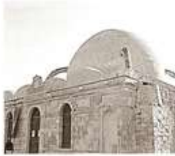
1645 tarihli Yenice Camii ise bugün müze ve konferans salonu olarak Yunanistan'a hizmet veriyor.

Bugün benzer oyunların Güneydoğu Anadolu ve Kıbrıs için döndüğünü rahatlıkla görebiliriz. Yine Avrupa'nın desteğini alan Yunanistan ve peşmergeler çeşitli şekillerde Türk devletini parçalamak için çaba harcamaktadırlar.