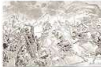
Girit'in Yunanistan'a ilhak günlerinde yazılmış olan yukarıdaki gravürde Rum palikaryaların gerçekleştirdiği katliam temsil ediliyor.