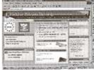
Derneğin Web Sayfası

Kamu sektöründe ya da özel sektörde çalışıyor olabilirsiniz, akademisyen olabilirsiniz, orta öğrenim ya da üniver-